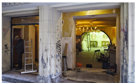
Kino Varšava v Liberci znovu ožívá.

Ve zrekonstruovaných prostorách libereckého kina Varšava byla 13. února slavnostně otevřena kavárna Káva. Spolek Zachraňme Kino Varšava hodlá z bývalého biografu postupně